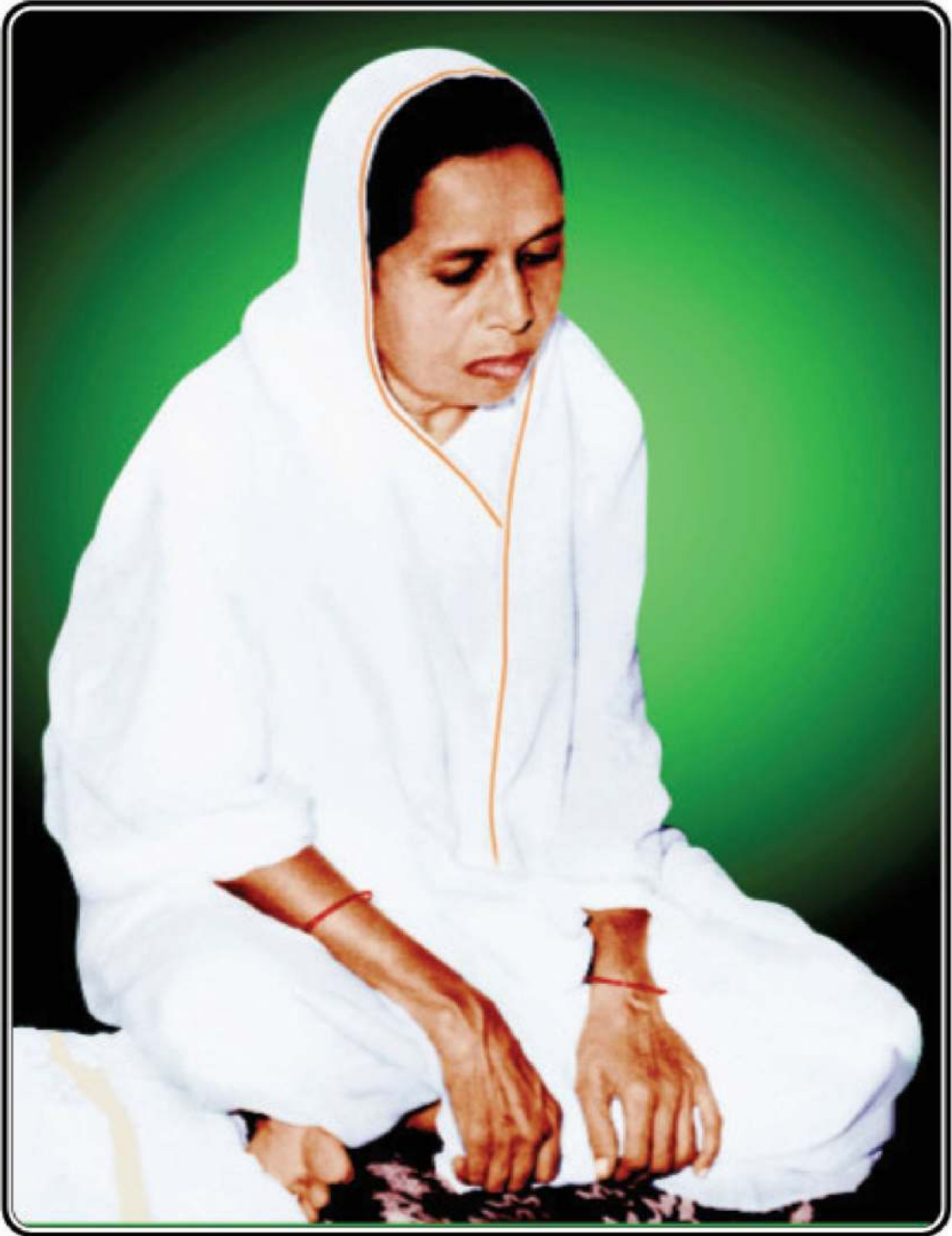
प्रशममूर्ति भगवती माता पूज्य बहिनश्री चम्पाबेन